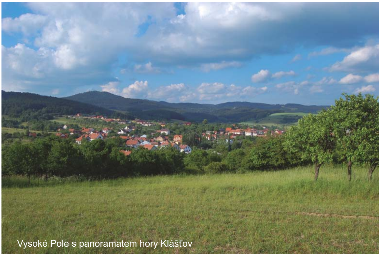
Vysoké Pole s panoramatem hory Klášťov

Hledáte-li málo známý kout Zlínského kraje, který oplývá kouzlem nepoznaného, krásami karpatských hor a pohostinností místních obyvatel, nesmíte zapomenout na jižní Valašsko. Teprve v posledních letech se tento region nedaleko slovenských hranic začal probouzet. Díky spolupráci představitelů zdejších samospráv, neziskového sektoru i místních obyvatel se z něj stává přitažlivý cíl pro návštěvníky všech věkových kategorií.