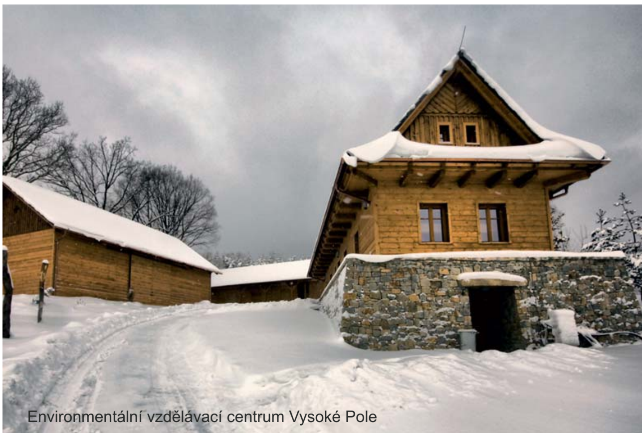
Environmentální vzdělávací centrum Vysoké Pole