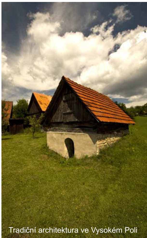
Tradiční architektura ve Vysokém Poli

Okruh šesti dědin dává bezpočet možností, jak jej absolvovat. Jen extrémním nadšencům lze doporučit jednodenní túru, při níž by přehlédli maximum zajímavostí, které trasa nabízí. Daleko příjemnější je