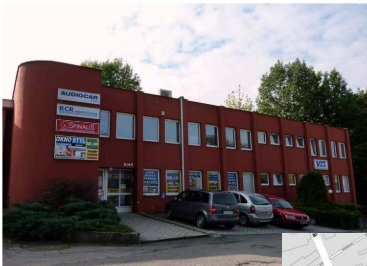
Foto budovy sídla

Těšíme se na setkání s Vámi v našich nových prostorách.