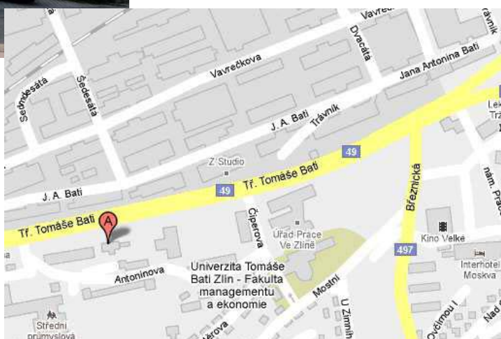
Mapa nové adresy