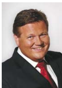
Zdeněk Škromach ČSSD