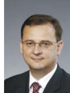
Petr Nečas ODS