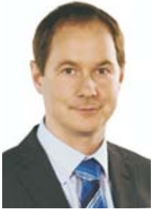
Petr Gazdík TOP 09