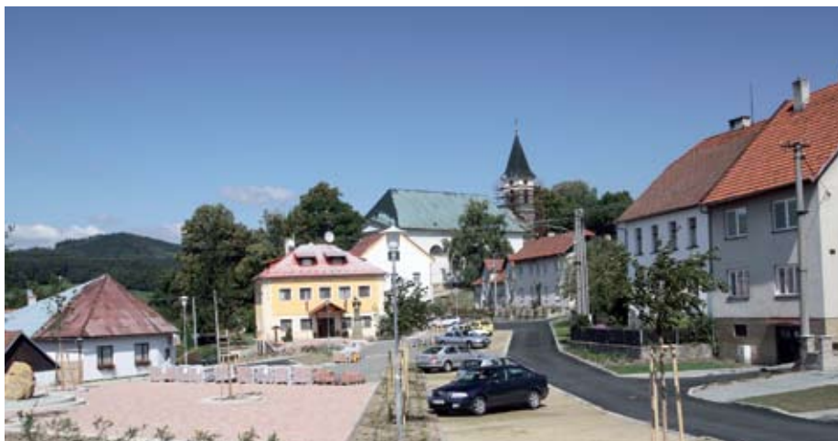
Obec Újezd se do soutěže přihlásila i přesto, že v době hodnocení ještě nebyla dokončena rekonstrukce náměstí a oprava kostela – výzva pro ostatní: nikdy nemusí být vše hotovo na 100%