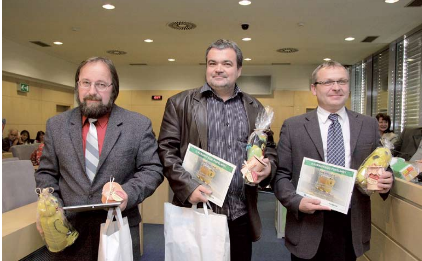
Představitelé nejlépe třídících obcí do 500 obyvatel