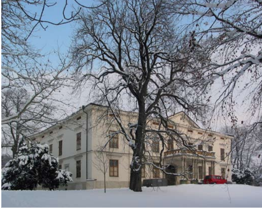
Zámek Lešná u Valašského Meziříčí

Svobodný statek Lešná se poprvé uvádí v zemských deskách roku 1355. Ve středověku sídlili zdejší vladykové na tvrzi obklopené vodním příkopem, písemně doložené k roku 1415, a patrně na přelomu 16. a 17. století přestavěné na pozdně renesanční čtyřkřídový jednopatrový zámek s arkádovým nádvořím. Posledními majiteli byli od roku 1887 do roku 1945 Kinští