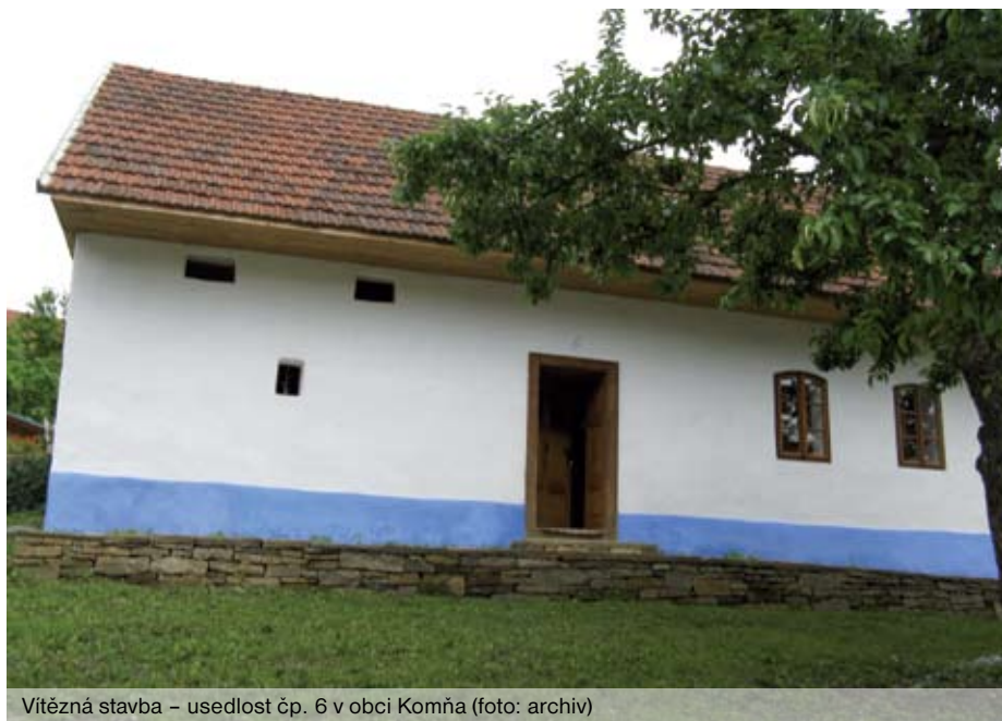
Vítězná stavba – usedlost čp. 6 v obci Komňa

P rojekt Lidová stavba roku, který byl loni schválen Radou Zlínského kraje, je v rámci České republiky stále ojedinělým. Uznání za nejlépe obnovenou lidovou stavbu je oceněním zájmu a iniciativy majitelů těchto objektů a jejich úsilí o záchranu jedinečných hodnot architektury našich vesnic. Projekt má v lidech obnovit zejména zájem o prostředí, v němž žijí. Velmi významné a důležité je i pro všeobecný stav hodnotných historických staveb na venkově obecné vědomí lidí o vztahu k těmto stavbám. Pro žádoucí změnu tvárnosti naší vesnice od novostaveb až po péči o památky lidového stavitelství je ze všeho nejdůležitější, aby se pozitivní vztah k tradičním hodnotám stal znovu součástí obecného povědomí. Snahou je tedy motivovat vlastníky i všechny zainteresované k uvědomění si hodnot a kvalit objektů lidového stavitelství a motivovat je tak k jejich zachování pro budoucí generace i pro udržení charakteristického rázu obcí, a tím i rozvoje turistického zájmu návštěvníků Zlínského kraje. Právě tradiční ráz vesnické zástavby a její kulturní krajiny může výrazně přispívat k rozvoji turistického ruchu v kraji, a tím i k jeho rozvoji ekonomickému, kulturnímu a společenskému.