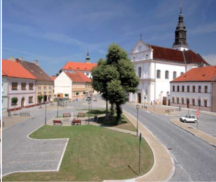
Čestné uznání v kategorii Realizace rozvojových projektů měst a obcí – oprava náměstí Sv. Ondřeje v Uherském Ostrohu