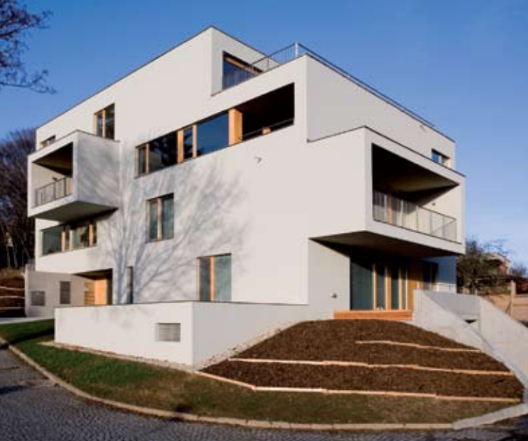
Hlavní cena v kategorii Domy pro bydlení – Bytový dům Zlín, Partyzánská