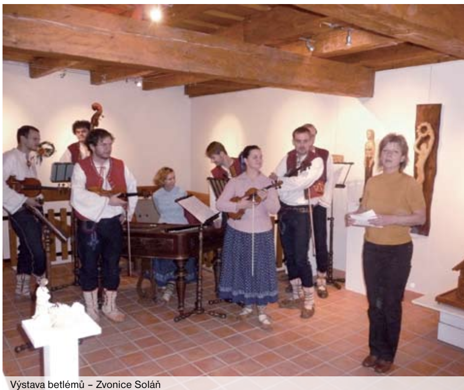
Výstava betlémů – Zvonice Soláň