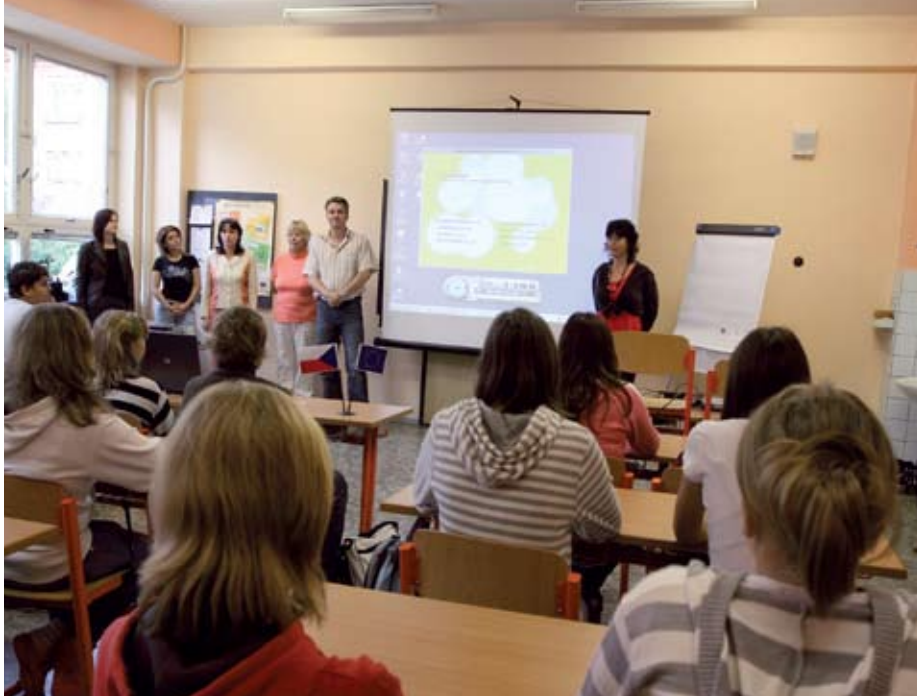
Počátkem října byl ve Zlínském kraji zahájen projekt Multikulturní škola, jehož cílem je bourání bariér mezi většinovou populací a cizinci, kteří se vlivem migrace stávají běžnou součástí společnosti. Informace o projektu poskytne oddělení neziskového sektoru krajského úřadu.