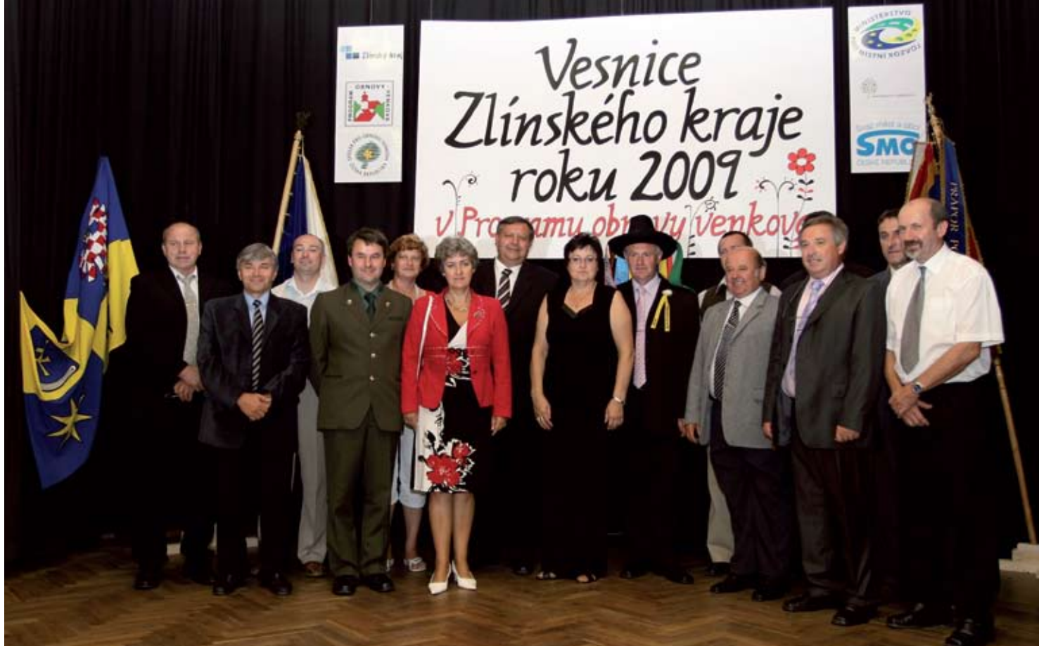
Snímek ze slavnostního ceremoniálu v Újezdu 24. srpna 2009

spolufinancování akce rekonstrukce návsi a 400.000 Kč na spolufinancování výstavby v lokalitě Předlípky)