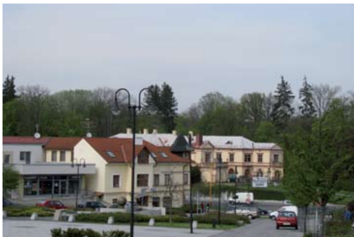
„Pohlednice ze Slavičina“

Jak vnímáte téma krajské identity devět let poté, kdy začal Zlínský kraj fungovat jako nový územně správní celek? Podařilo se během doby existence Zlínského kraje vytvořit povědomí jednoho společného provázaného celku, nebo je spíše považován za jednotku uměle vytvořenou?