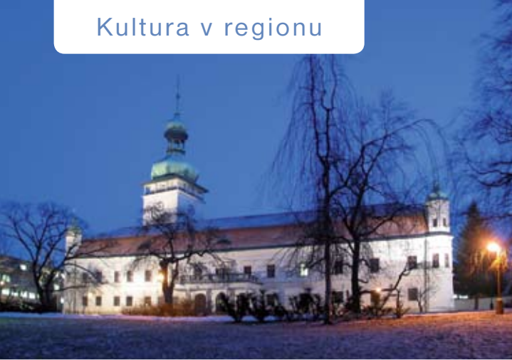
Zámek Vsetín