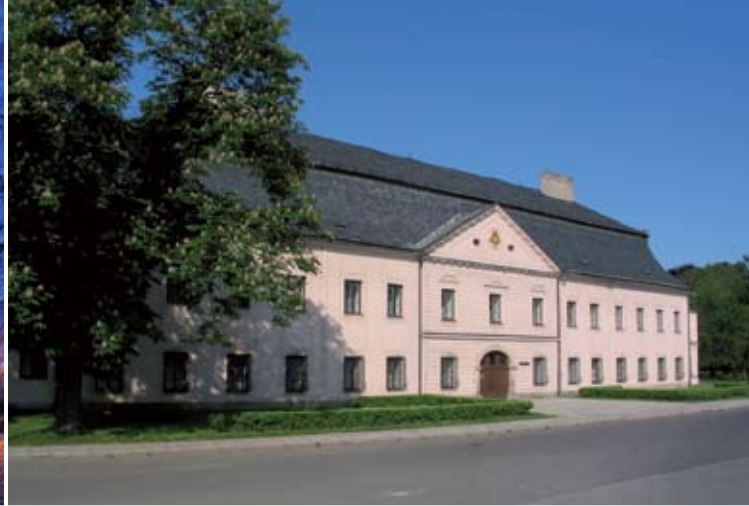
Zámek Kinských ve Valašském Meziříčí