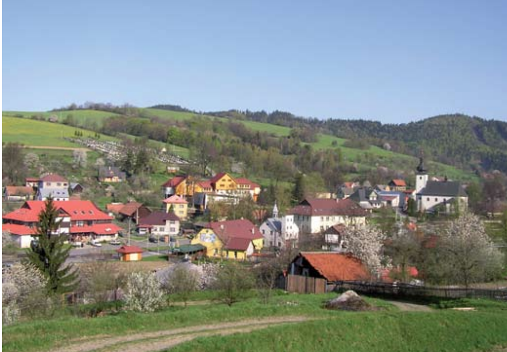
Obec Lidečko

Úspěch v soutěži je jistě příjemný, ale život jde dál. Když jsme uspěli, neznamená to, že všechno máme vyřešené a všechno děláme